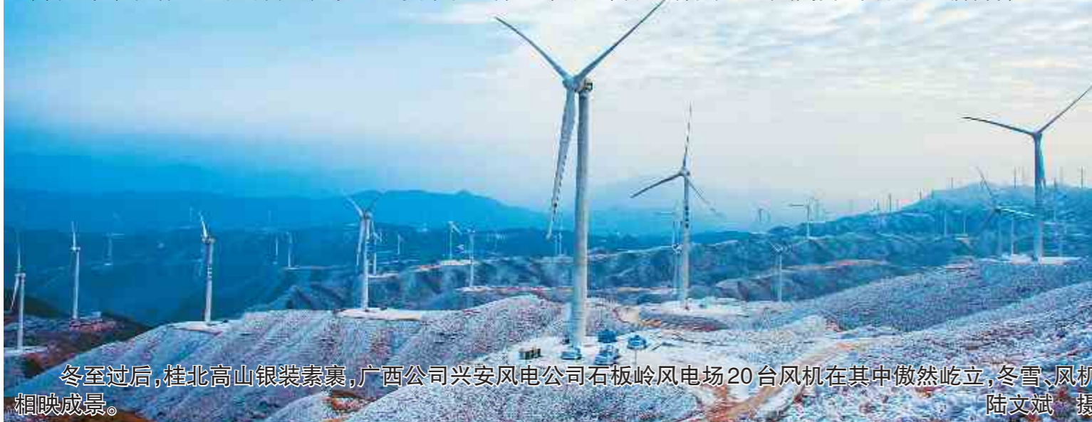
冬至过后,桂北高山银装素裹,广西公司兴安风电公司石板岭风电场20台风机在其中傲然屹立,白雪、风机相映成景。

GW82/1500千瓦型风机叶片叶尖延长技术的应用,不仅提升了发电效率,同时也为该技术推广应用打下坚实基础,是积极贯彻落实集团公司打好“三副牌”要求的有力实践。下一步,广西公司还将通过定期进行数据分析、叶片巡检优化、叶片增功技术推广等方式,进一步巩固扩大增功提效成果,发挥示范项目引领作用,助力集团公司高质量发展再上新台阶。