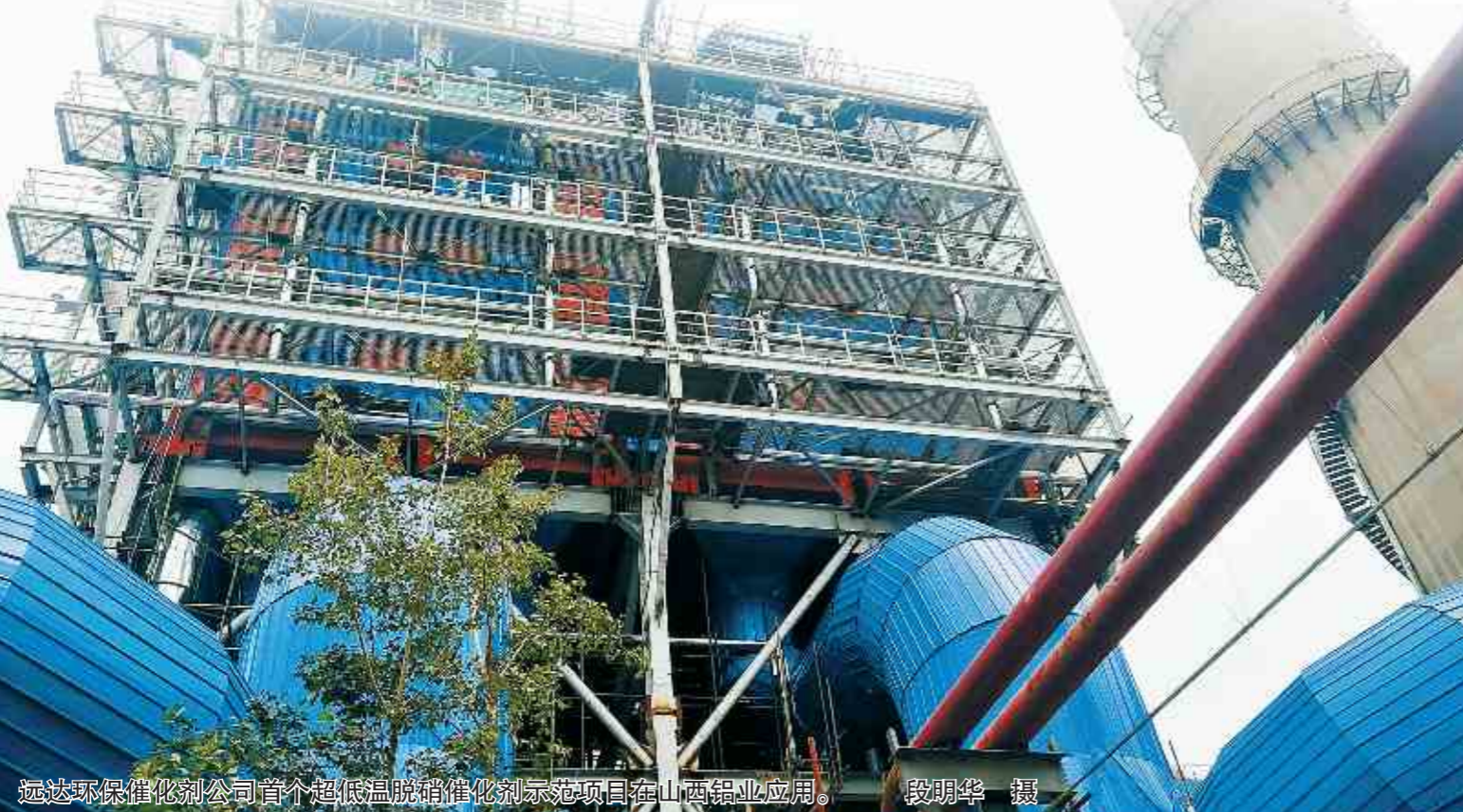
远达环保催化剂公司首个超低温脱硝催化剂示范项目在山西铝业应用。