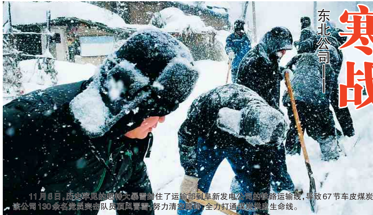
11月8日,虎头罕嘎铁路将大暴雨冲垮了运输部到阜新发电公司的铁路运输线,导致67节车皮煤炭无法进厂,该公司130余名党员突击队顶风冒雪,努力清除障碍,全力打通煤炭供应生命线。

两年来,内蒙古公司持续加大路港板块全方位投入,用先进的技术改造铁路、港口,对路港板块实施了全面的环保和装备升级改造,让路港板块几家企业发生了脱胎换骨的变化。在历史的长河中,谁会想到,此前经营不善的路港公司,在与内蒙古公司重组2年后,又再次焕发了新的生机和活力。今年9月份,受国内经济持续恢复和国际大宗能源原料价格上涨等影响,国内出